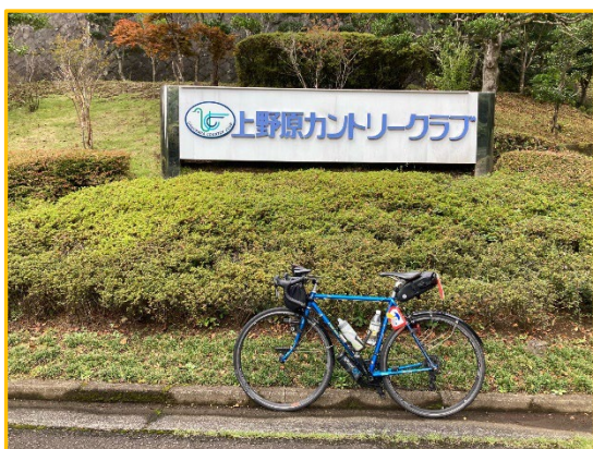
No.34 上野原カントリークラブ入口

2 箇所は、フォトコントロールです。それぞれ指定の看板等と自分のバイクを入れて写真を撮って下さい。※通過時間は不問です。