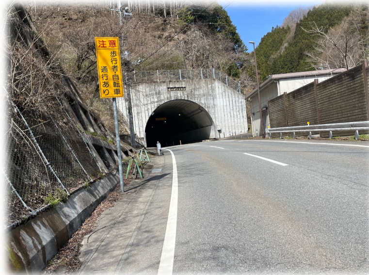
139.5キロ地点：湯の沢トンネル (714m)