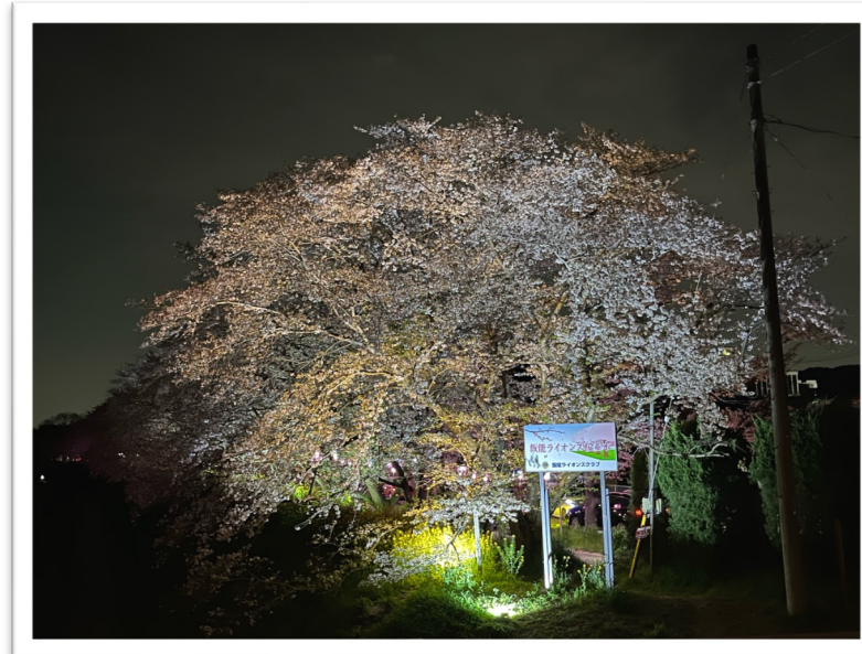
キューシート88：飯能の夜景