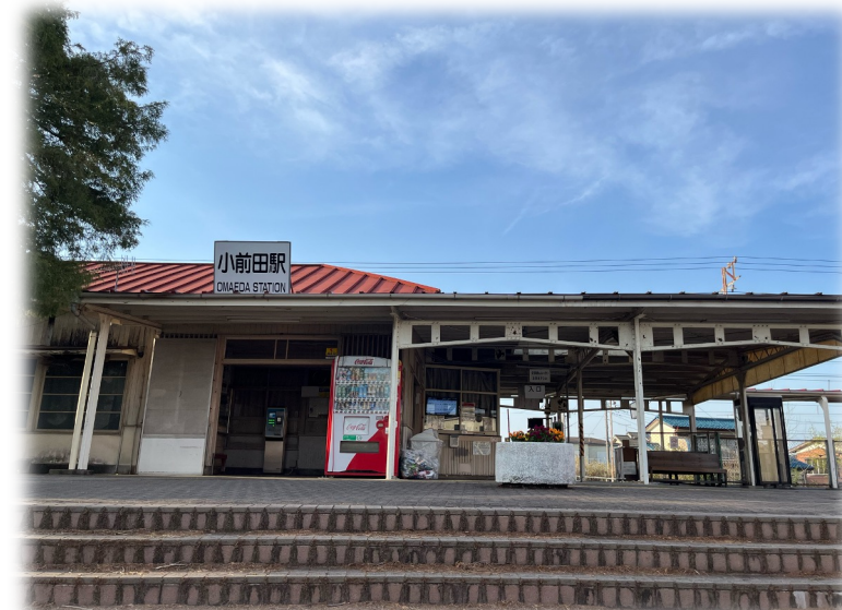
205.7キロ地点：小前田駅（記念撮影スポット）