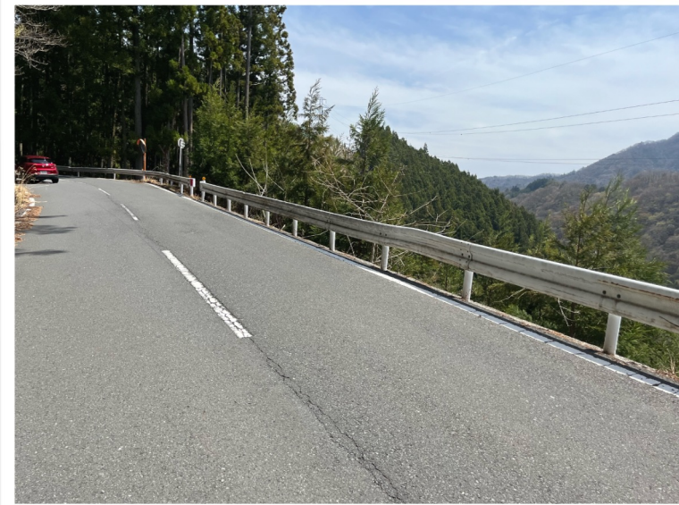
キューシート48：志賀坂峠