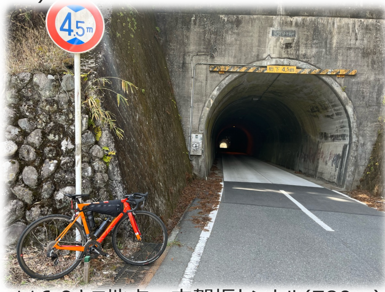
116.9キロ地点：志賀坂トンネル(780m)