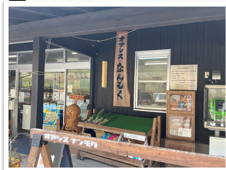
キューシート56：道の駅オアシスなんもく