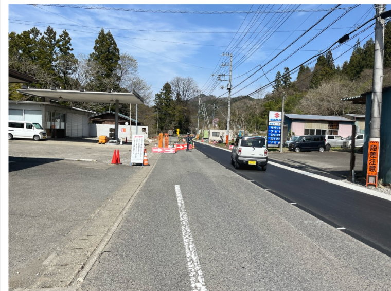
キューシート56：CP3前の工事