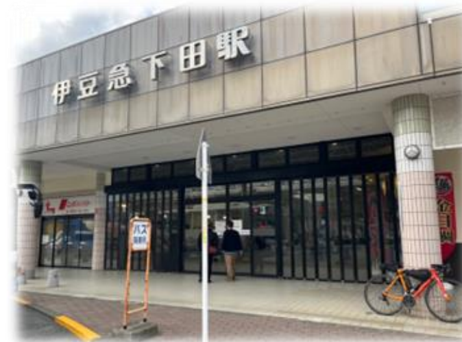
コントロール9 下田駅の看板