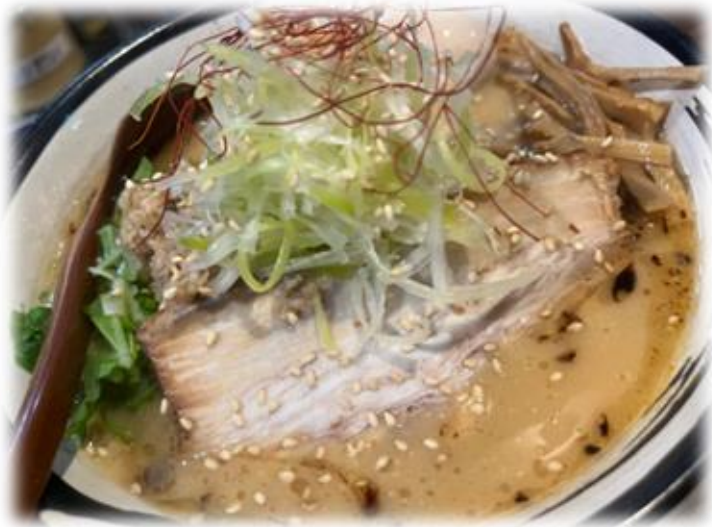
柏崎付近：ご当地ラーメン🍜