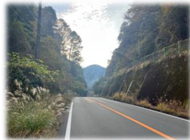
675キロ地点付近：興津へ向かうR52