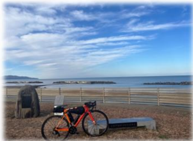
コントロール4 船見公園内のオブジェクト

※キューシートの指示通り、到達したことがわかるように対象オブジェクトを撮影ください。※周囲の邪魔にならないように配慮ください。