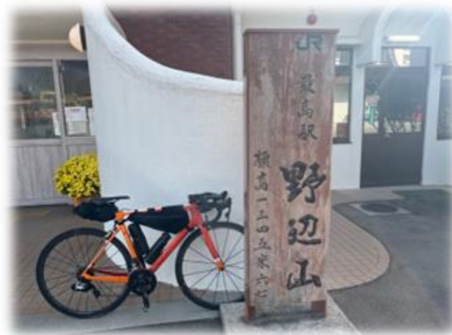
549.3キロ地点：野辺山駅