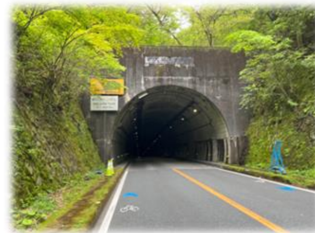
798.4キロ地点：新天城トンネル