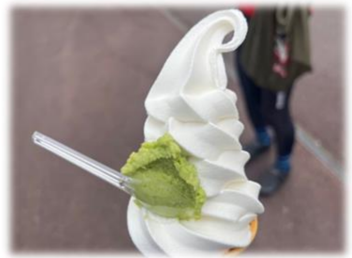
道の駅天城越えのワサビアイス🍦