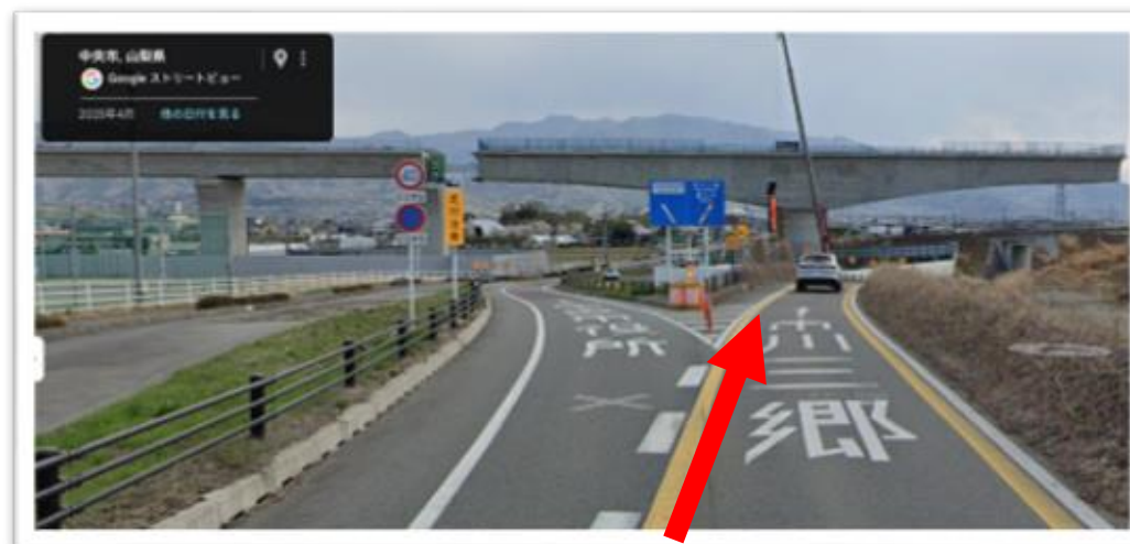
キュー-142：道路ペイント通り市川三郷方面へ