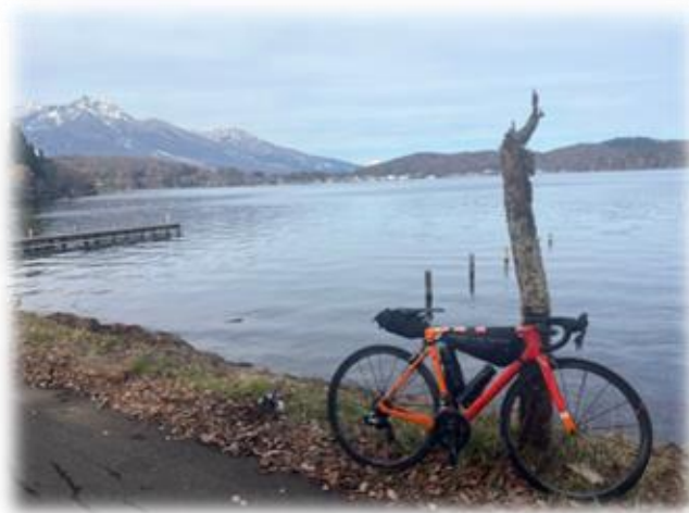
417キロ地点付近：野尻湖