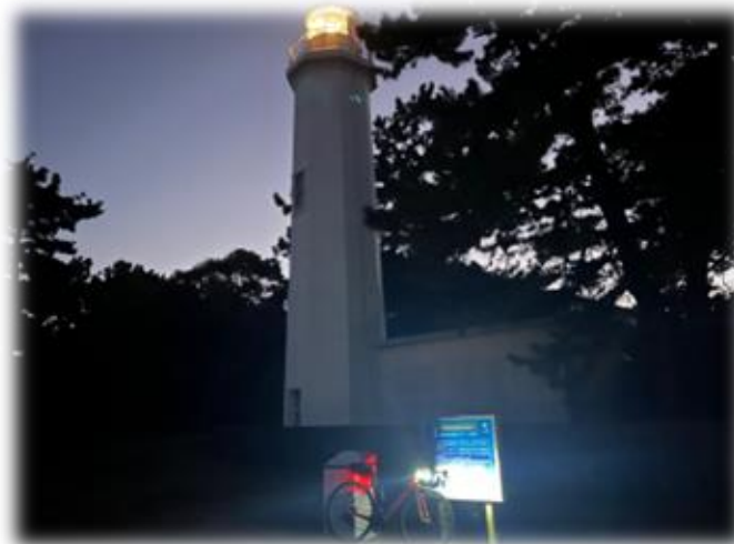
コントロール8 清水灯台看板