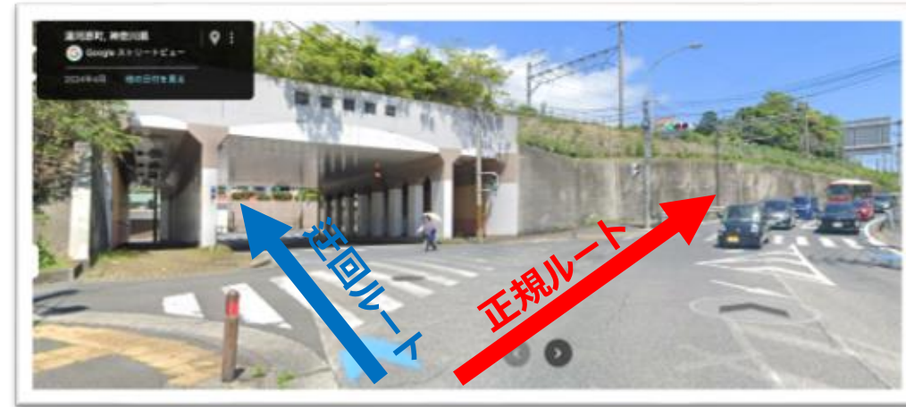
キュー189：真鶴新道（正規ルート）と旧道（迂回ルート）