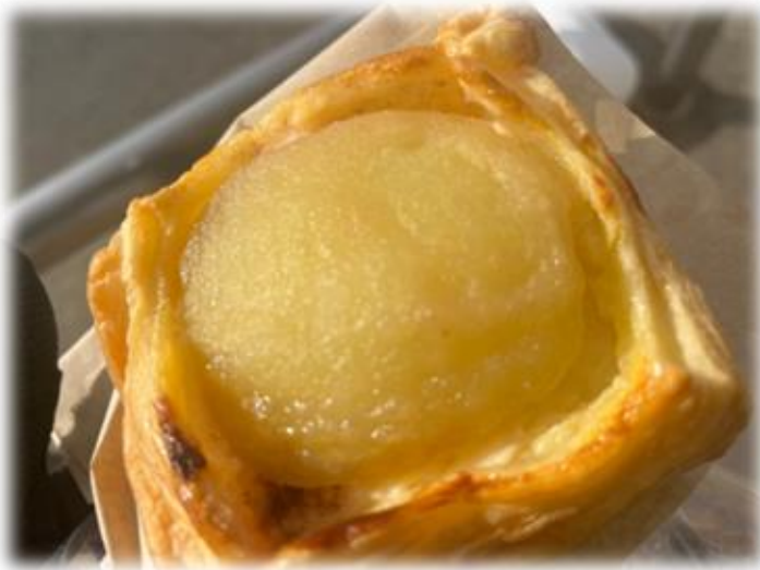
コントロール5付近：信州りんごのプルパイ🍏とピザ🍕