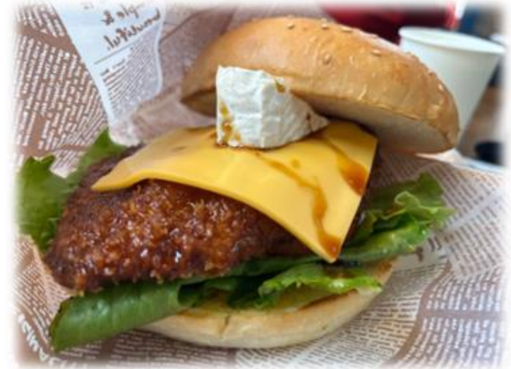
コントロール9付近：道の駅下田の下田バーガー🍔