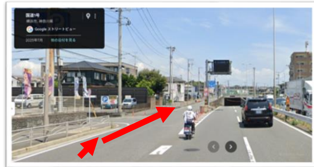
キュー199：キープレフトで側道へ