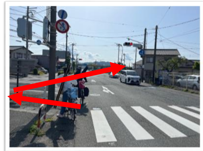
キュー166：横断歩道を渡ってからR414方面へ