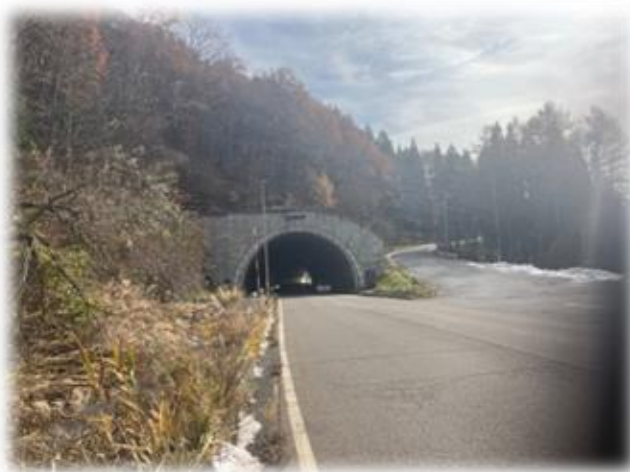
414.8キロ地点：野尻トンネル入口