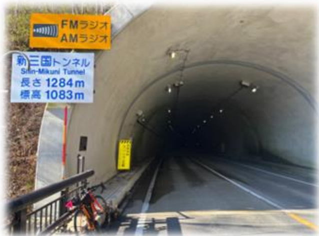
201.5キロ地点：新三国トンネル入口