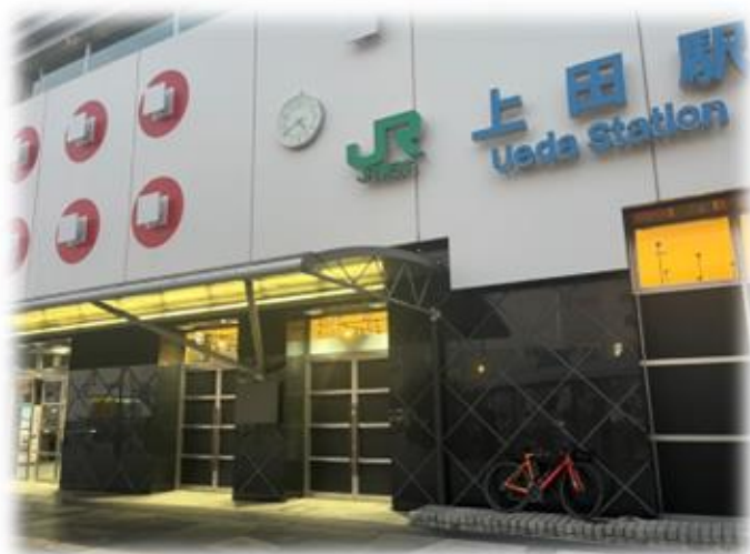
コントロール6 JR上田駅の看板